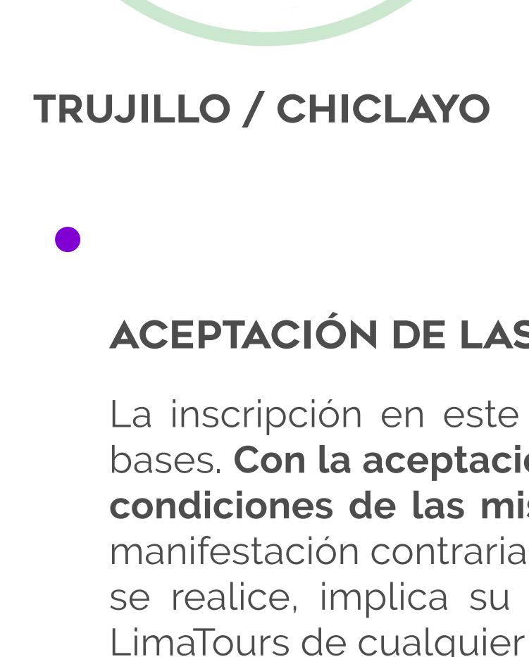
TRUJILLO / CHICLAYO